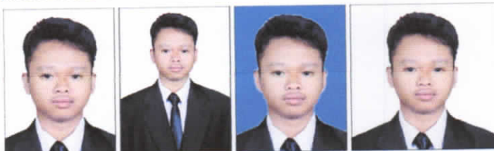
BENAR Latar putih, ukuran 3x4 dan wajah jelas.