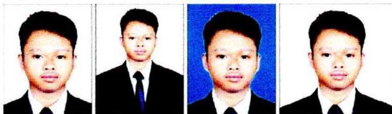
BENAR Latar putih, ukuran 3x4 dan wajah jelas.