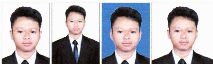
BENAR Latar putih, ukuran 3x4 dan wajah jelas.