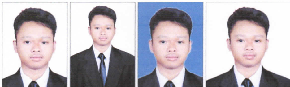
BENAR Latar putih, ukuran 3x4 dan wajah jelas.